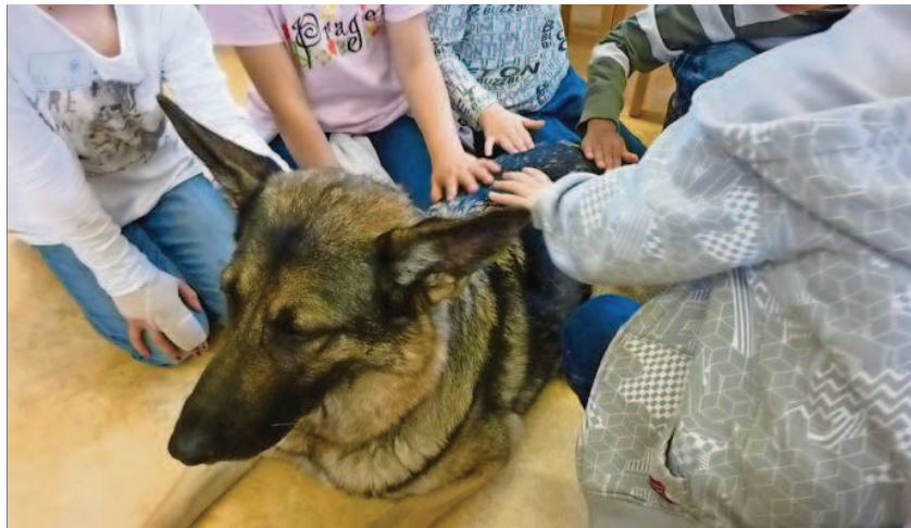
Im kontrollierten und angstfreien Umgang mit Therapiehündin Fadrin lernen die Kindergartenkinder den respektvollen Umgang mit dem Tier.

Beispiel von Sandra Altorfer gefolgt und bringen ihre für tiergestützte Pädagogik ausgebildete Vierbeiner sporadisch mit in den Unterricht. Ein solcher «Schulhund» bringt laut Ausbilderin Sandra Altorfer viele positive Aspekte in das Klassenzimmer.